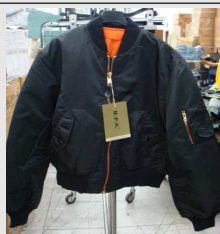
Bomber MA-1 Vintage H.P.S.

I giubbotti H.P.S. Replica sono stati realizzati con gli stessi tessuti ed accessori dei giubbotti Alpha